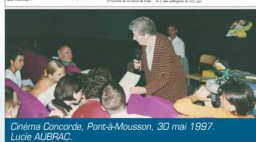
Cinéma Concordia, Pont-à-Mousson, 30 mai 1997. Lucie AUBRAC