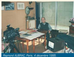
Raymond AUBRAC, Paris, 4 décembre 1995

Durant la deuxième partie de la décennie 1990-2000, une autre période s'ouvre, qui privilégie les entretiens avec des témoins de la Seconde Guerre mondiale. Un projet lié à la sortie du film "Lucie Aubrac" de Claude Berri, en 1997, puis un voyage scolaire, en avril 2000, comprenant une étape de l'itinéraire présenté dans le livre de Jérôme Scorin, donnent un prolongement aux activités des années 1990-1995.