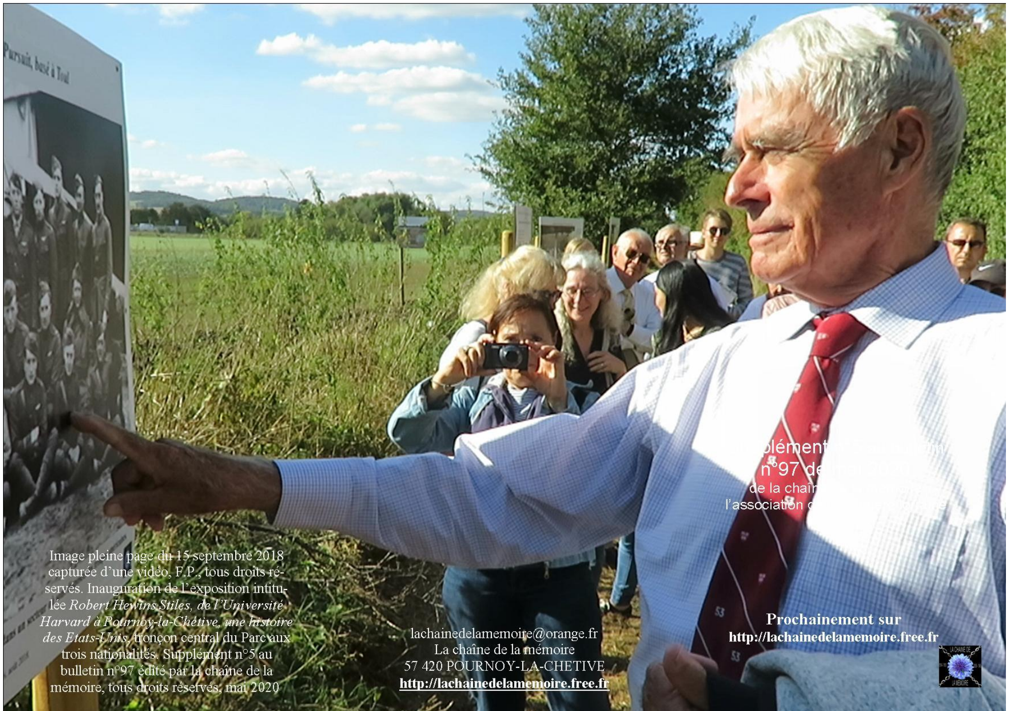
Image pleine page du 15 septembre 2018 capturée d'une vidéo, F.P., tous droits réservés. Inauguration de l'exposition intitulée Robert Hewins Stiles, de l'Université Harvard à Pournoy-la-Chétive, une histoire des Etats-Unis , tronçon central du Parc aux trois nationalités. Supplément n°5 au bulletin n°97 édité par la chaîne de la mémoire, tous droits réservés, mai 2020

lachainedelamemoire@orange.fr La chaîne de la mémoire 57 420 POURNOY-LA-CHETIVE http://lachainedelamemoire.free.fr