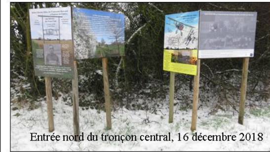
Entrée nord du tronçon central, 16 décembre 2018

Sur l'entrée nord, les textes sont en Français alors qu'ils sont en Anglais sur l'entrée sud. Le début de l'exposition de 52 visuels commence sur l'entrée nord.