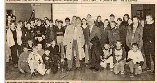
Les collégiens entourent les témoins des événements.