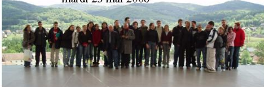
Mémorial Alsace-Moselle mardi 23 mai 2006

Les visages des participants nous ramènent à l'année scolaire 2005-2006, et à une période de la chaîne de la mémoire déjà bien éloignée.