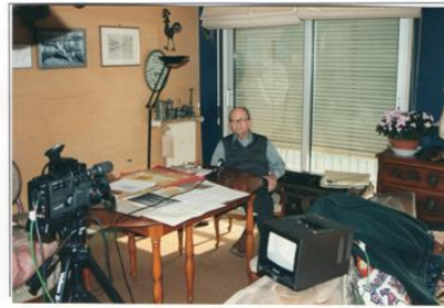
Raymond AUBRAC, Haut Responsable de la Résistance Intérieure.

vétérans de la Deuxième Guerre mondiale recueillis pour la cassette vidéo Le Prix de la Liberté », terminé en mai 1996.