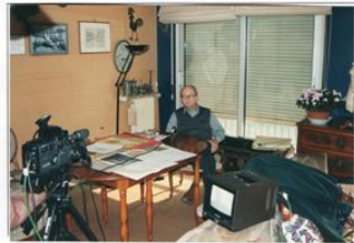
Raymond AUBRAC, Haut Responsable de la Résistance Intérieure. Arrêté à Caluire en même temps que Jean Moulin

Un entretien présenté sur la page 82 de l'ouvrage non édité intitulé « Reportage photographique sur les témoignages de résistants, déportés et